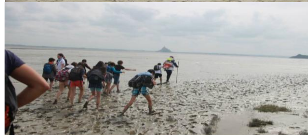
Traversée de la baie du Mont Saint-Michel