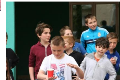
Après-midi : Jeux par équipes constituées de collégiens et d'élèves du primaire.