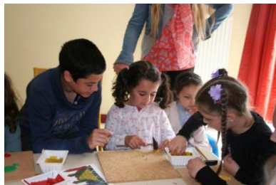
Matin : Chaque collégien est responsable d'un enfant de maternelle, qu'il emmène faire des ateliers.